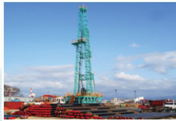
さく井工事の様子

井戸を掘る「さく井」工事を中心に、井戸のメンテナンスや関連する土木工事、地下水関連設備工事、地質調査などを手掛けています。1912年創業の日本初のさく井工事会社として、100年以上にわたり全国各地で豊富な地下水開発の実績があります。社員のうち約3割が女性で、現場の技術職にも女性社員が増えています。